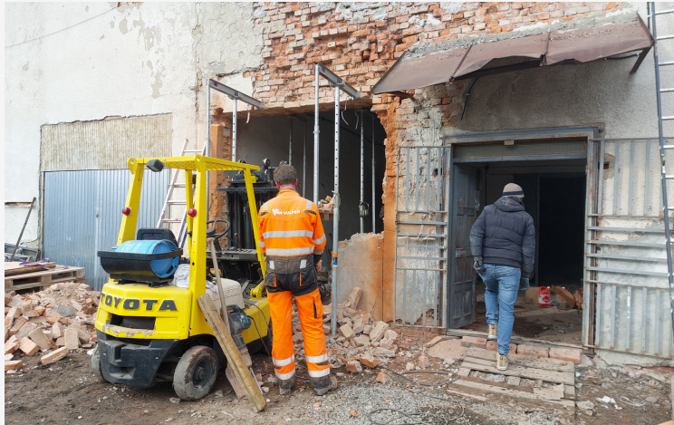
De vernieuwde opslag in aanbouw

De mensen uit Nederland hebben binnen een paar dagen een nieuwe ingang geplaatst, beton gestort en de koelcel geplaatst. Ook de elektriciteit is geïnstalleerd. Wat is er hard gewerkt en wat is het mooi geworden! U hartelijk dank voor de financiële bijdrage om dit mogelijk te maken. Op dit moment zijn er nog grote stellingen onderweg vanuit Nederland, die in de opslag geplaatst kunnen worden, zodat we nog efficiënter kunnen werken en meer goederen kunnen opslaan.